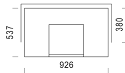
BLANKA CERAMIC Nieve