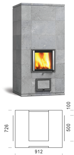
MAMO SOLO 180