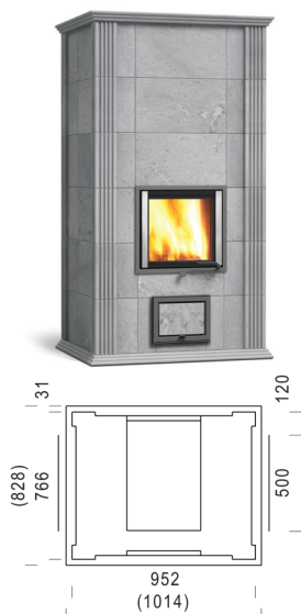
MAMO SOLO 180-2